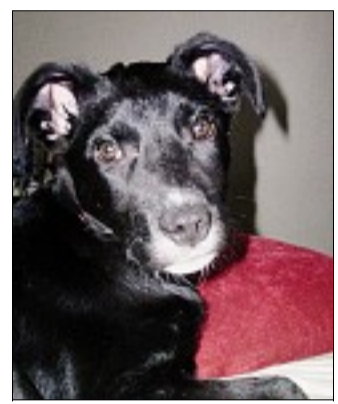
LINKA. La petite croisée labrador est née dans un terrier.

Le refuge donne rendez-vous au public les 16 et 17 mars à l'occasion du Printemps des Animaux. ■