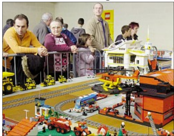
LEGO. On appréciera l'extraordinaire évolution de la petite brique rouge née au Danemark en 1934 et qui, depuis près d'un siècle a su faire des petits... THIERRY LINDAUER

Tout ce qui vole, vogue, et roule, du 1/43 ème jusqu'à la taille réelle... C'est à la 6 ème biennale du modélisme de Ceyrat qui propose jusqu'à ce soir 18 heures, un plateau véritablement exceptionnel.