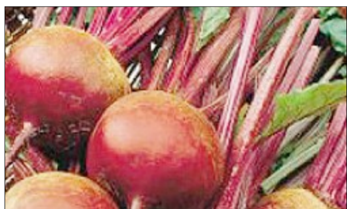
SANTÉ. La betterave rouge est un panier de vitamines.

Cette racine, de la famille des chénopodiacées, se sème dès que les gelées ne sont plus à craindre, et jusqu'en juillet. Cousine de la betterave sucrière, elle est très consommée en France, en Angleterre, Allemagne, Italie, Espagne et Grèce.