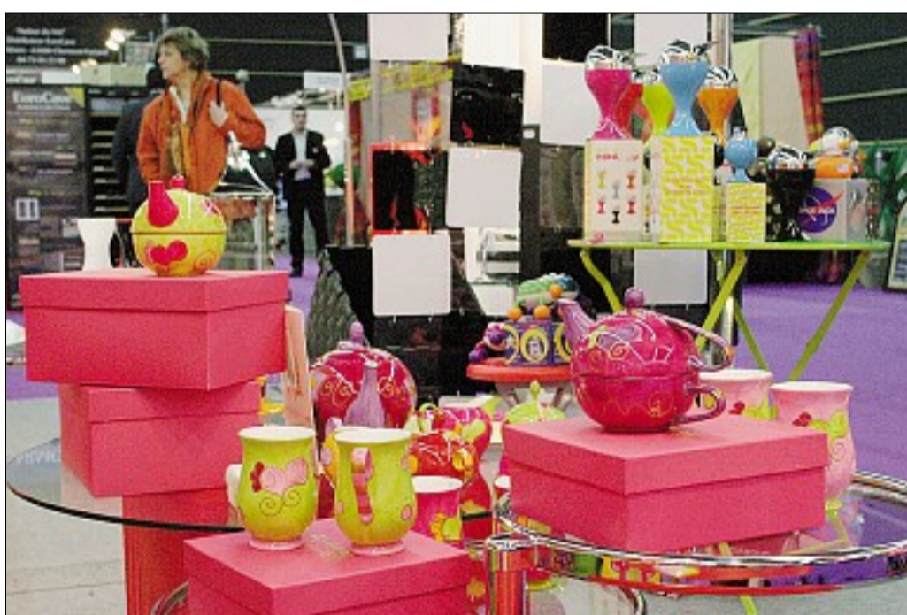
VISITE. Le salon, ouvert depuis jeudi de 10 à 20 heures, fermera ses portes lundi soir.

Un petit tour par les cuisines et les salles de bain, avec leur kit de balnéothérapie, par quelques stands un peu isolés d'objets utilitaires, du genre aspirateur... Mais qui n'étaient là que pour faire de